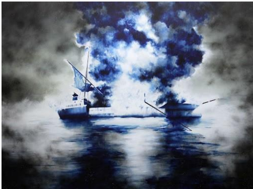
Gamaliel Rodríguez, Collapsed Soul , 2020-21. Tinta y acrílico sobre tela, 84 x 112 pulg. (213.3 x 284.5 cm).

Del 23 de noviembre de 2022 al 23 de abril de 2023