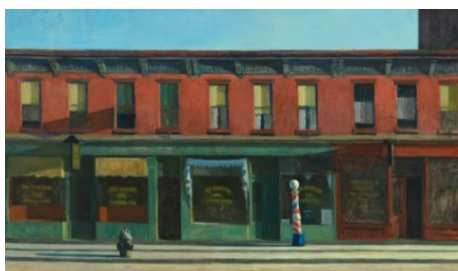
Edward Hopper, Early Sunday Morning , 1930. Óleo sobre tela, 35 3/16 x 60 1/4 pulg. (89.4 x 153 cm). Whitney Museum of American Art, Nueva York; Compra hecha con fondos de Gertrude Vanderbilt Whitney 31.426 © Herederos de Josephine N. Hopper/Con licencia de Artists Rights Society (ARS), Nueva York

Del 19 de octubre de 2022 al 5 de marzo de 2023