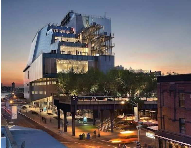
Vista desde Gansevoort Street. Fotografía por Ed Lederman, 2015.